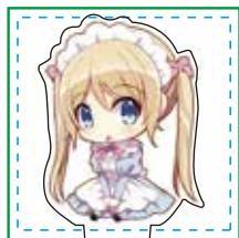
デザイン・カットパス 配置参考