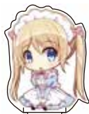
カットパスに 差込を差し込む